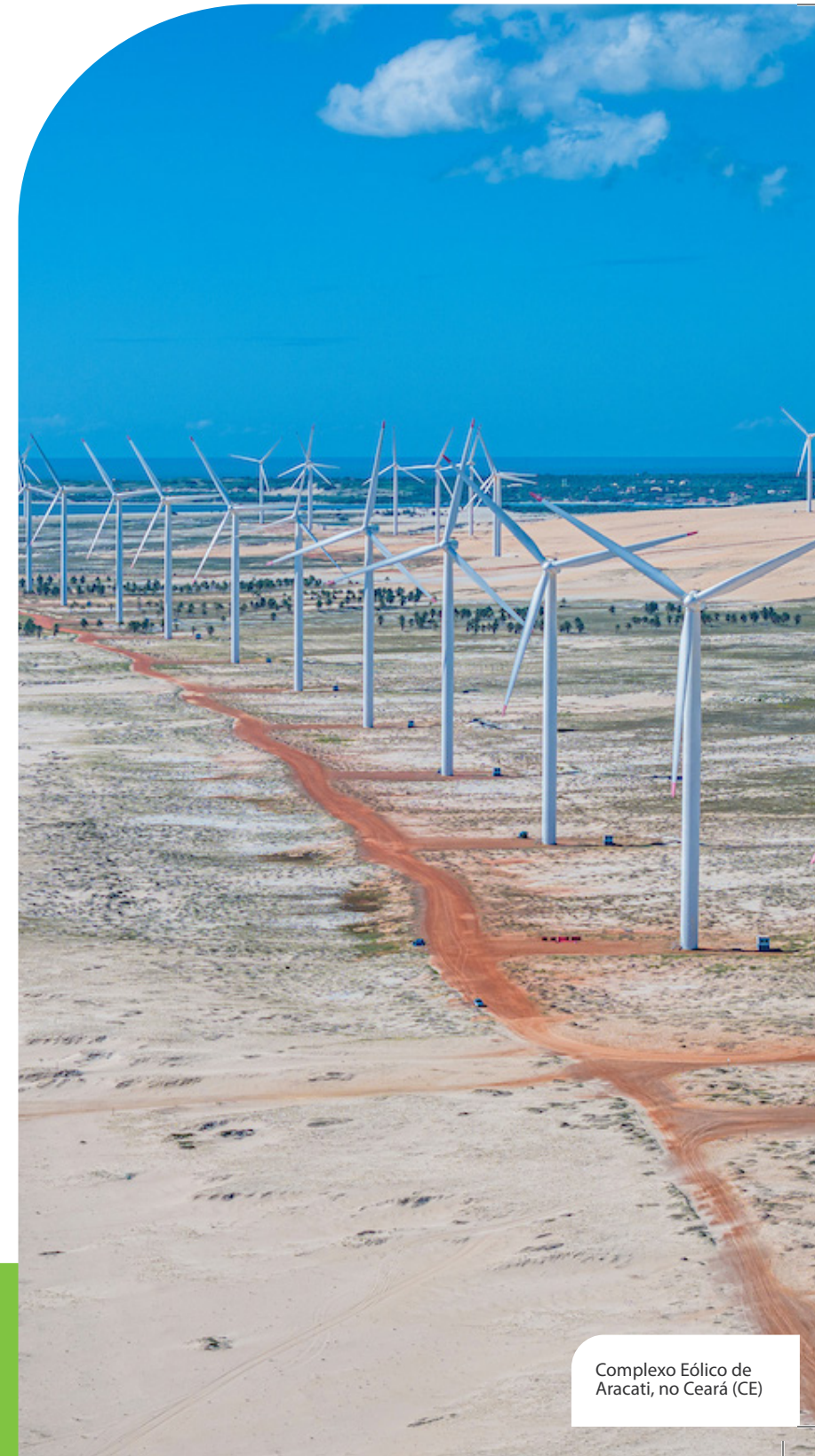
Complexo Eólico de Aracati, no Ceará (CE)

Na geração, concentramos o monitoramento dos ativos em Campinas (SP), integrando as operações em um centro que funciona continuamente. Essa estrutura reúne acompanhamento em tempo real, análise preditiva e gestão de riscos, permitindo antecipar falhas e apoiar respostas mais rápidas.