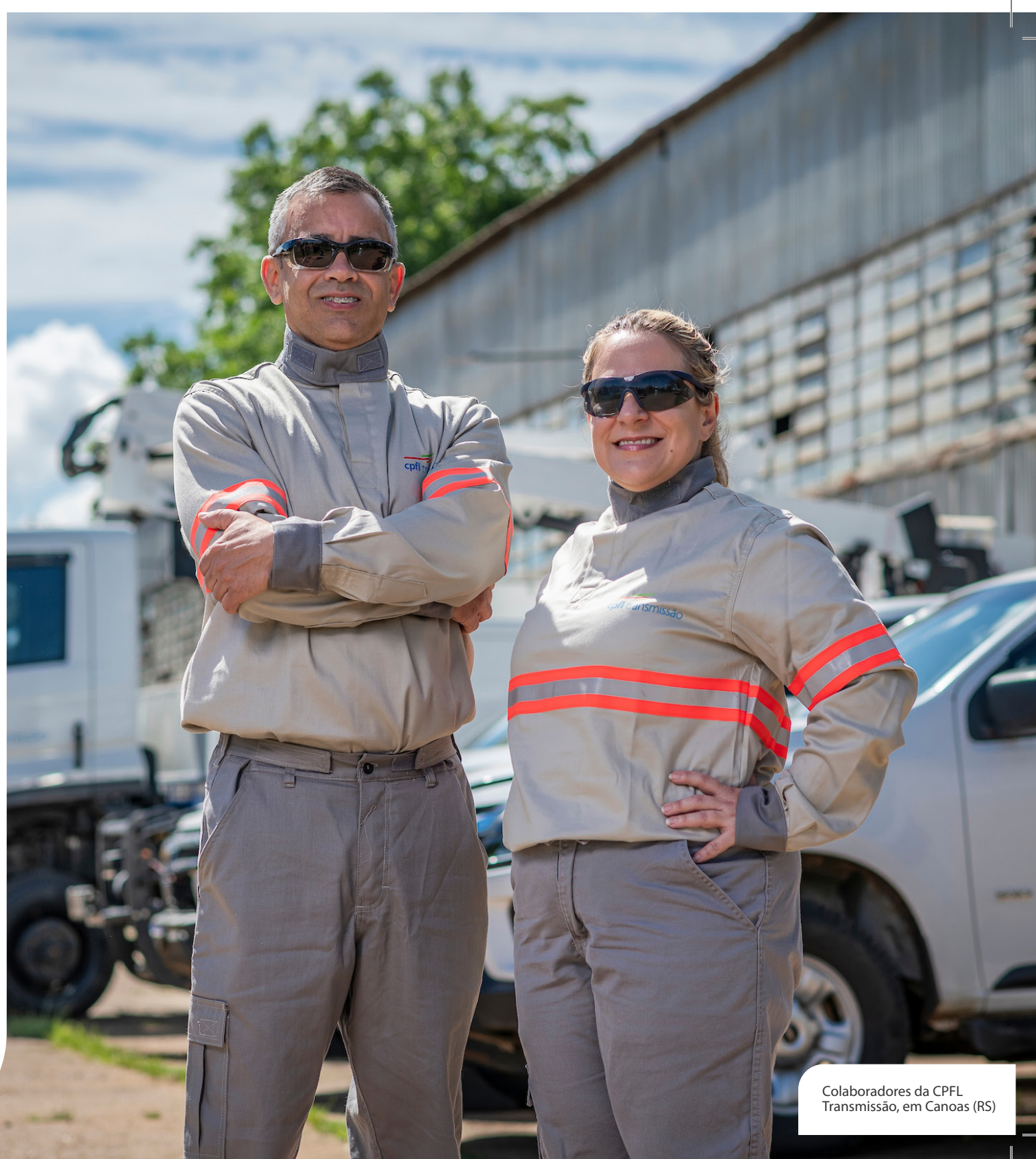
Colaboradores da CPFL Transmissão, em Canoas (RS)

Nesse contexto, iniciativas como o programa Guardiã da Vida e o programa Arborização +Segura contribuem para reduzir riscos à população e reforçar a conscientização sobre o uso seguro da energia. Em 2025, investimos R$ 2,2 milhões no Guardiã da Vida e R$ 21,9 milhões no Arborização +Segura, ampliando ações educativas, intervenções preventivas e parcerias com municípios.