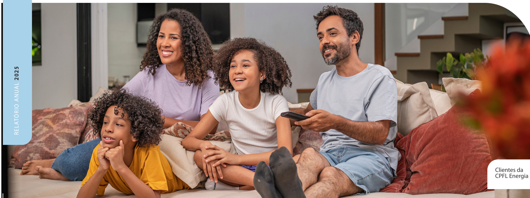
Clientes da CPFL Energia

O Programa de Voluntariado Semear seguiu como um dos principais instrumentos de engajamento social. Em 2025, contou com mais de 4.600 participações de colaboradores e 1.200 de convidados, em 156 ações que beneficiaram mais de 16.800 pessoas e 32 organizações. As iniciativas envolveram apoio a projetos sociais, ações de saúde e atividades educativas, fortalecendo a presença da companhia nos territórios e o vínculo com as comunidades.