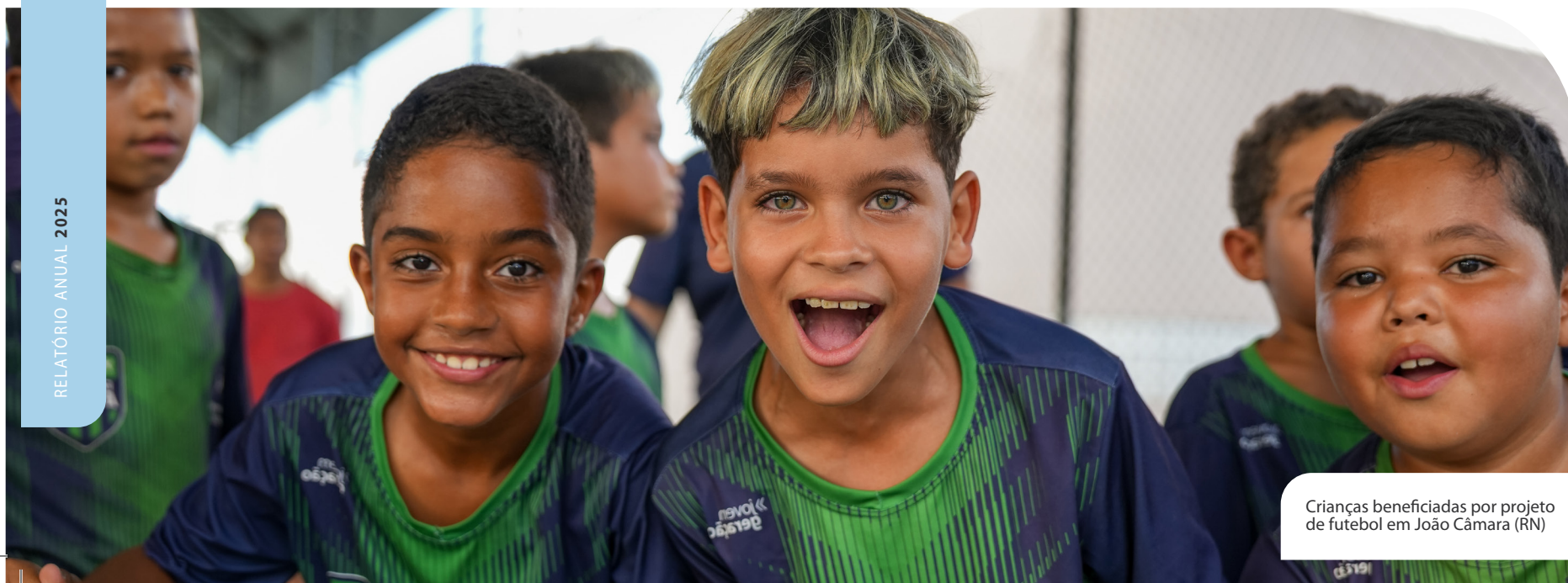
Crianças beneficiadas por projeto de futebol em João Câmara (RN)

Também mantivemos a participação em iniciativas e compromissos com o mercado, promovendo a troca de experiências e o aprimoramento contínuo das práticas. Em 2025, seguimos presentes em índices e certificações que reconhecem avanços na agenda de diversidade, refletindo a integração do tema à estratégia do negócio.