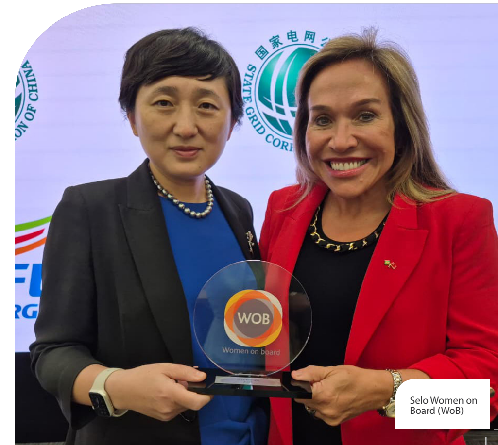
Selo Women on Board (WoB)

Pelo 7º ano consecutivo, a CPFL Energia foi considerada uma das maiores empregadoras do Brasil pelo Top Employers Institute.