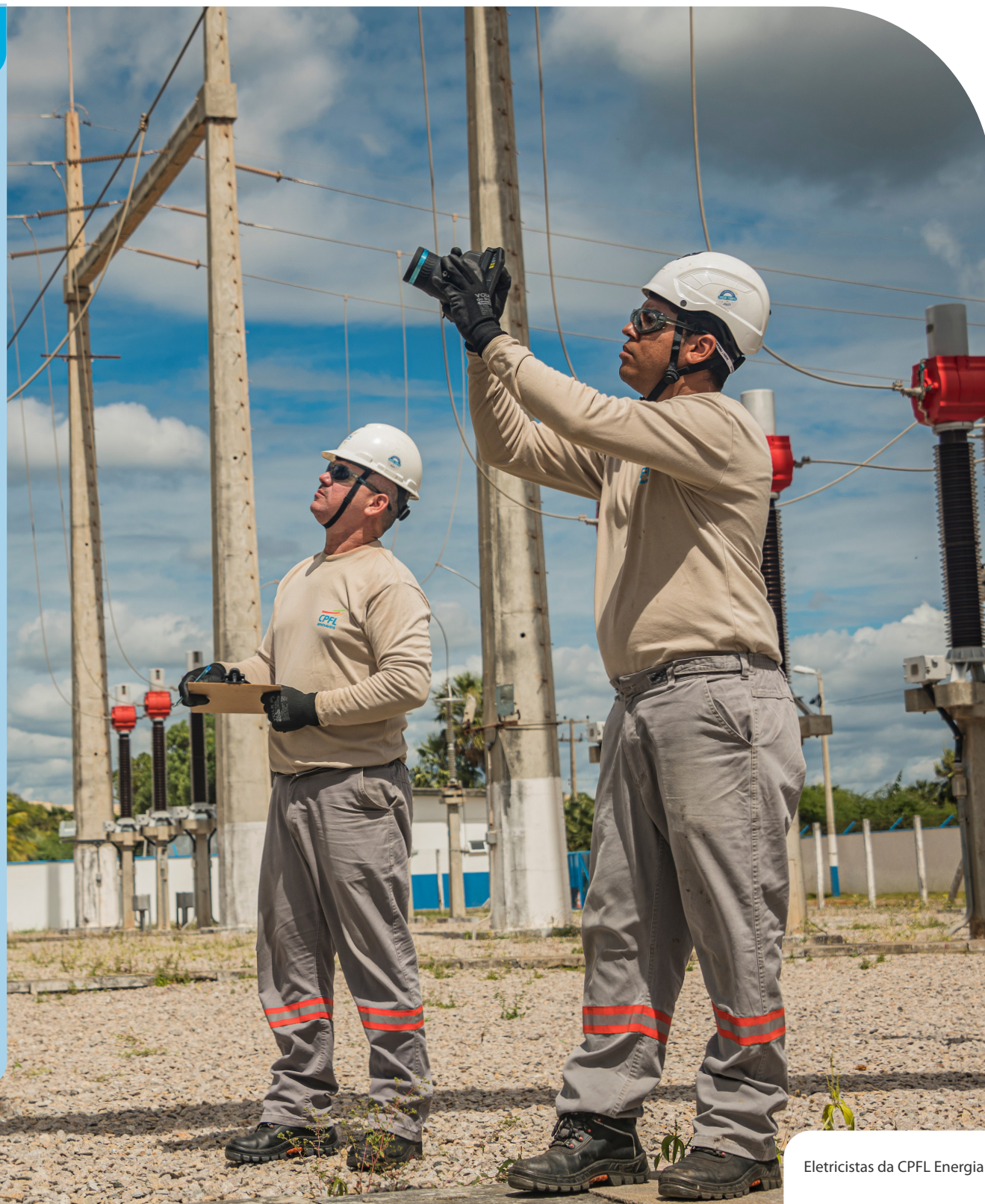
Eletricistas da CPFL Energia