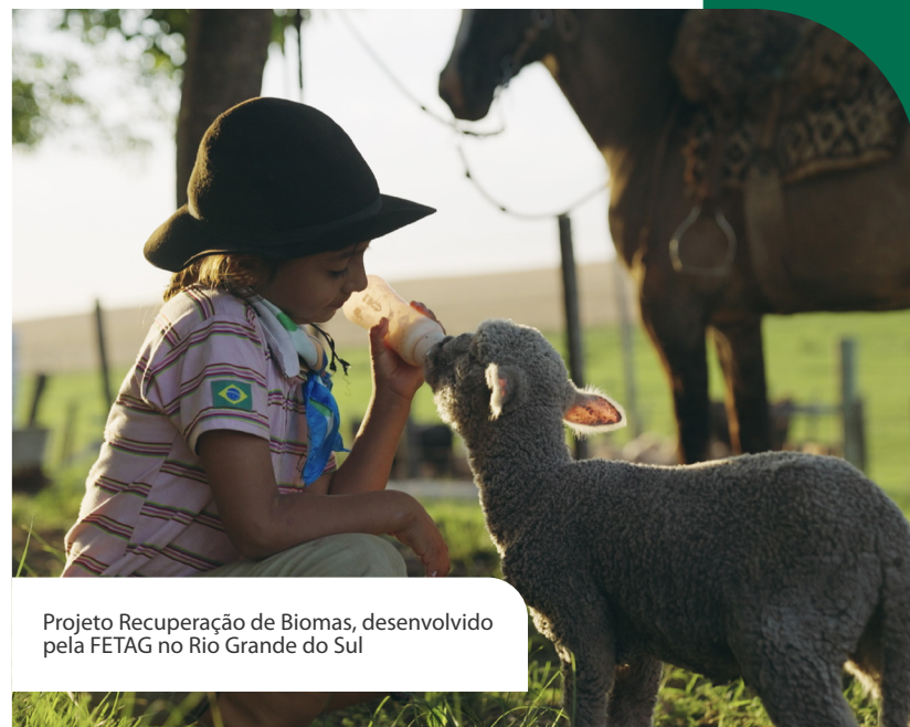
Projeto Recuperação de Biomas, desenvolvido pela FETAG no Rio Grande do Sul

Além das operações, desenvolvemos projetos socioambientais em parceria com comunidades locais, voltados à restauração de áreas, proteção de nascentes, fortalecimento da agricultura sustentável e geração de renda. Essas iniciativas contribuem para a conservação de biomas, a segurança hídrica e o desenvolvimento dos territórios onde atuamos.