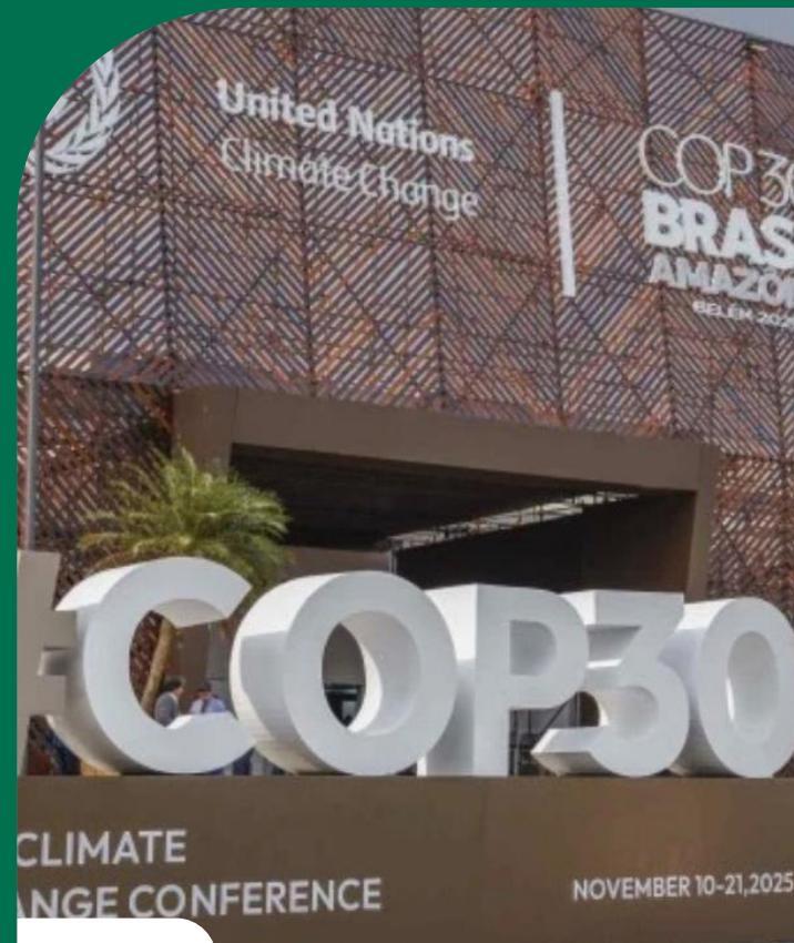
COP30, realizada em Belém, Pará

Ao participar da COP30, reafirmamos o nosso compromisso com o protagonismo do setor elétrico na descarbonização da economia e com a construção de um futuro energético cada vez mais limpo e resiliente para o Brasil.