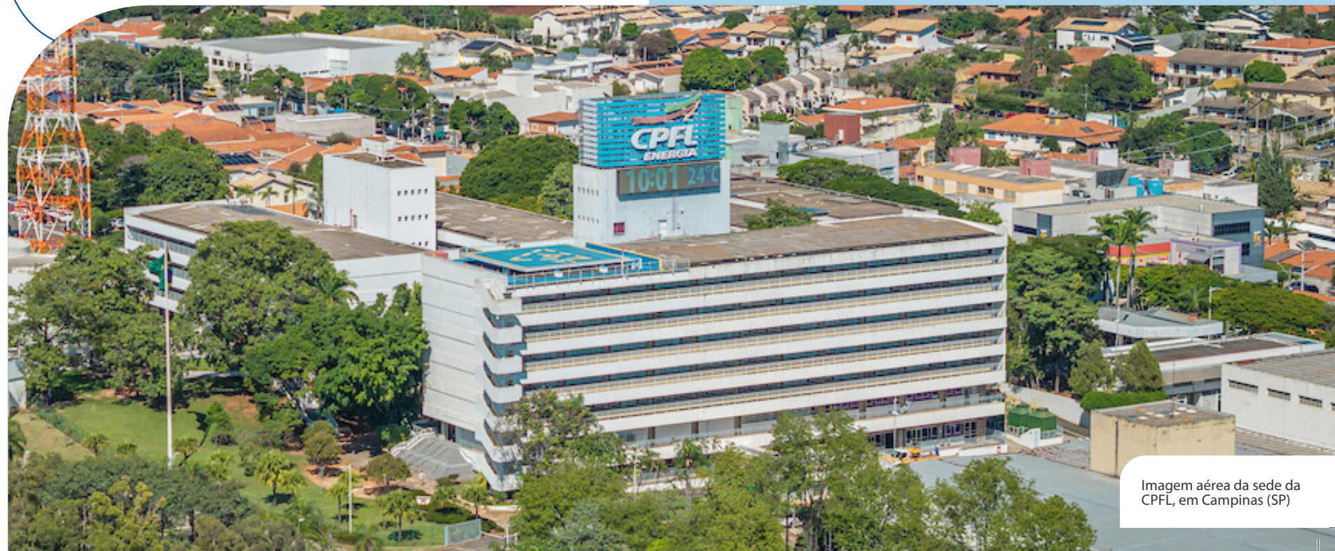
Imagem aérea da sede da CPFL, em Campinas (SP)