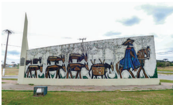
Mural de Poty Lazzarotto, localizado na Lapa, retrata o tropeirismo no Paraná.