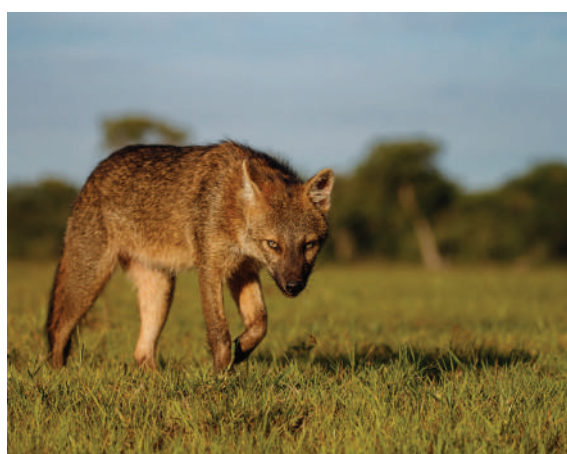
Cachorro-do-mato ( Cerdocyon thous )

O monitoramento da flora teve o objetivo de identificar as espécies de vegetação presentes nas ilhas do Rio Iguaçu. Os estudos e monitoramento sobre a fauna e flora locais permitem entender e prever possíveis impactos sobre a biodiversidade local.